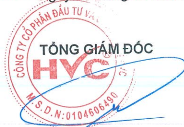
Trần Hữu Đông